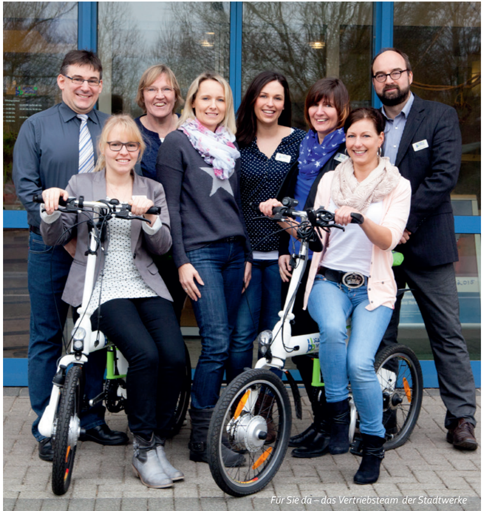
Für Sie da – das Vertriebsteam der Stadtwerke