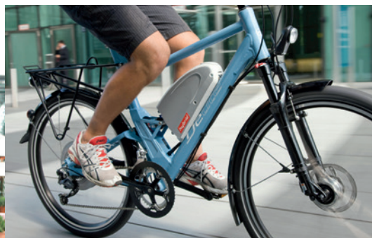
Hübsche Idee: Die Akkus sind leicht zugänglich und bei einigen Modellen im Fahrradrahmen untergebracht.